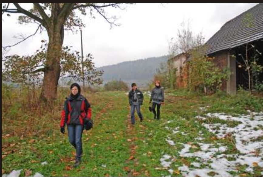
Zagórze, 18 X 2009. Przy pracy nad projektem