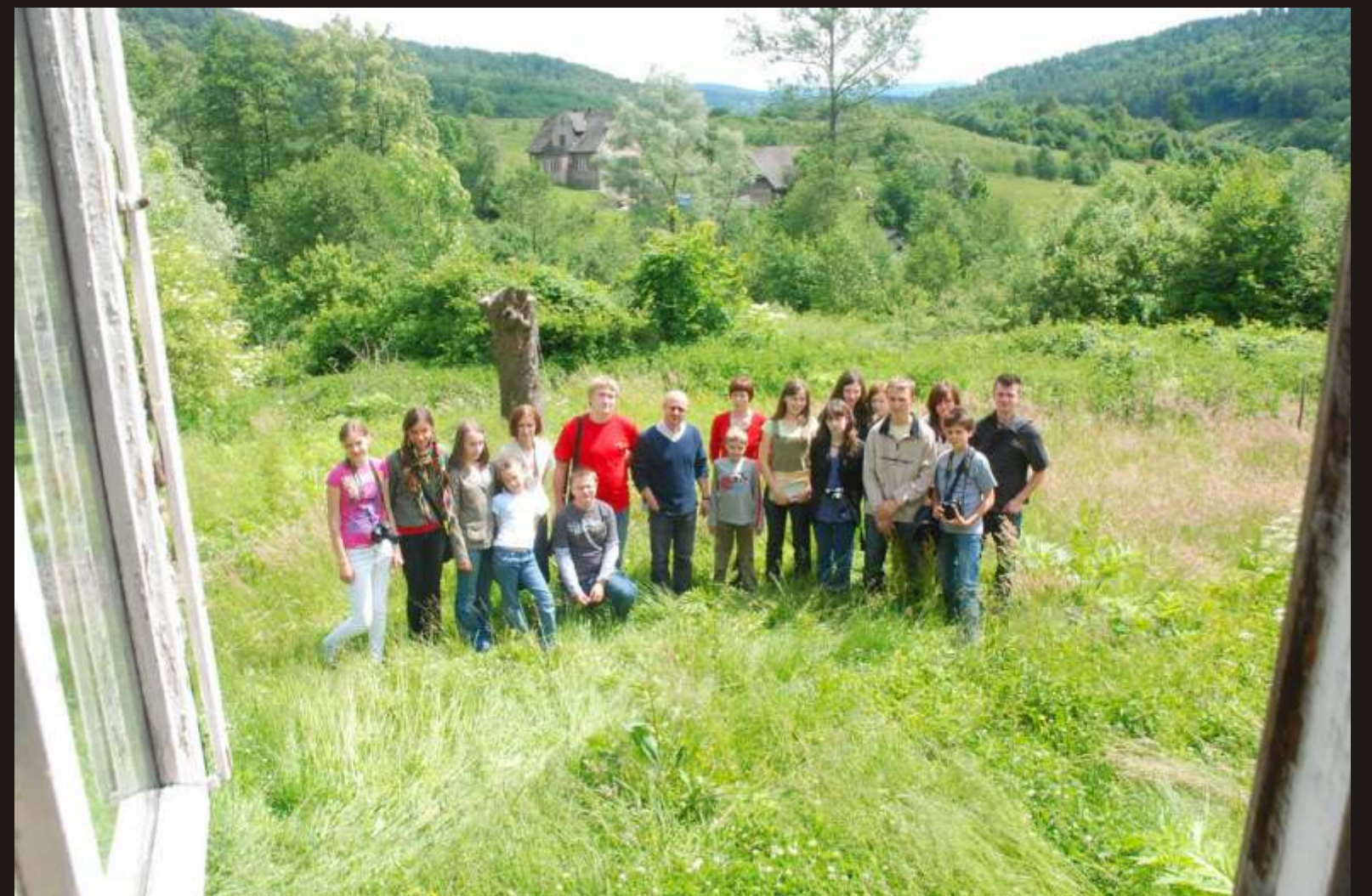
Zagórze, 7 VI 2009. Warsztaty z Mikołajem Grynbergiem