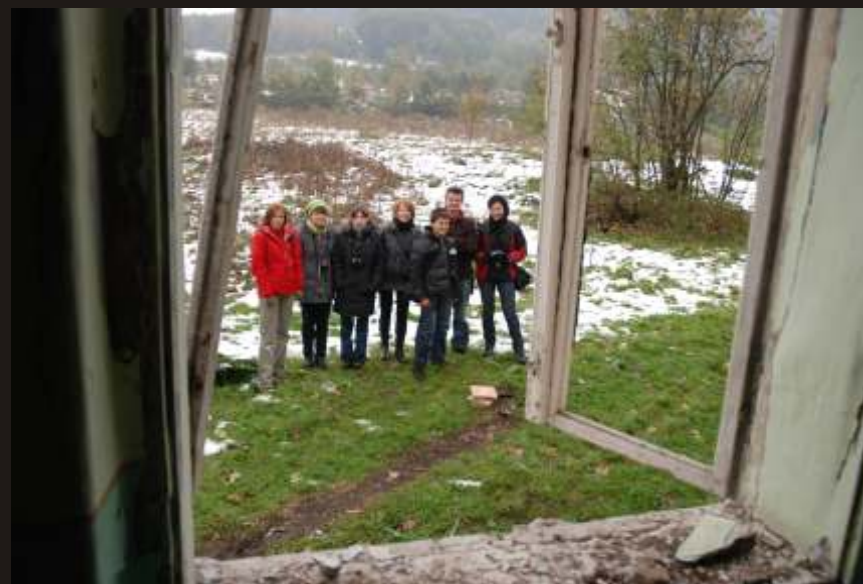
Zagórze, 18 X 2009. Przy pracy nad projektem