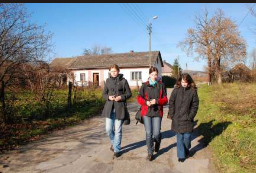
Skawce, 14 XI 2009. Przy pracy nad projektem