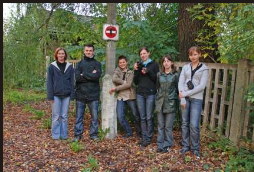
Skawce, 30 IX 2009. Przy pracy nad projektem